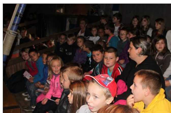
■ Les enfants ont découvert l'univers du cirque grâce à la compagnie basée à Traitiefontaine.

Tous furent ravis de cette rencontre avec des artistes exceptionnels.